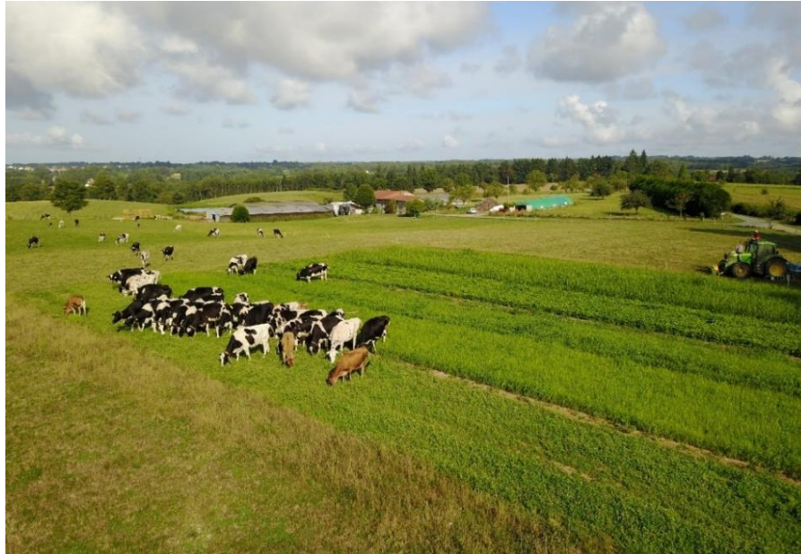
Les vaches à leur arrivée sur l'essai, 1 ère pâture, 12 août 2019

Essai réalisé à Saint Saud Lacoussière (24) chez M. Garat (éleveur 50 vaches laitières bio)