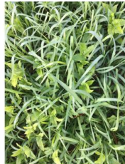
Moha *Cow Pea