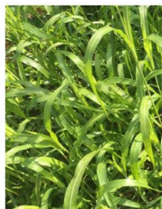
Sorgho *Cow Pea