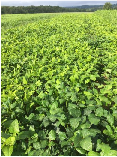
Cow pea avant 1 ère pâture au 12/08

Le 12 août au soir, toutes les bandes étaient rasées, sauf celle de cow pea. Les vaches ont eu accès à l'essai la nuit, et le lendemain matin le cow pea était consommé dans son intégralité !