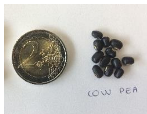
Graines de cow pea

Le cow pea (variété Black Stalion) et le lablab sont des nouvelles légumineuses fourragères estivales commercialisées pour la première fois en France par Semental en 2018. Le cow pea se sème sur sol réchauffé (12°C) à partir de la mi-mai (préférer même les semis après fin mai) et semble adapté à une large gamme de types de sol sauf aux sols très argileux et humides/mal drainés. Il possède un PMG de 66g, s'apparente à un soja et mesure au maximum 1mètre de hauteur. Quand il est associé au sorgho (valorisation attendue en ensilage) il peut envoyer tardivement quelques tiges s'accrocher sur celles du sorgho. Le cow pea comme le lablab ne fleurissent pas dans le département, et ne produisent donc pas de graines.