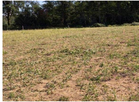
Cow pea après 1 ère pâture au 13/08

La seconde pâture a eu lieu le jeudi 12 septembre pendant la visite de l'essai. Seulement 18 mm étaient tombés depuis le 12 août, les couverts avaient tous repoussés mais étaient peu développés. Les hauteurs d'herbe moyennes étaient de 11 cm pour le sorgho, 13 cm pour le cow pea, 16 cm pour le moha et 3 cm pour les trèfles. Nous avons observé les vaches à la pâture et leur comportement différait de celui du 12 août. Elles ont navigué entre les différentes bandes et ont cette fois mangé le cow pea rapidement comme les autres espèces.