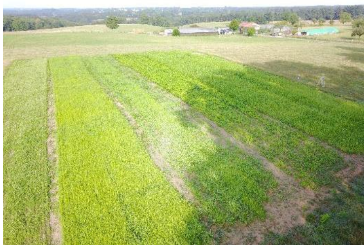
Vue aérienne de l'essai au 12 août, les 6 bandes sont visibles (de gauche à droite : trèfles, moha, moha*cow pea, cow pea, sorgho*cow pea, sorgho)

Vidéo de présentation de l'essai visible sur la chaîne YouTube de la Chambre d'agriculture : https://www.youtube.com/channel/UCPaivCvZnqr66uEs_k0t_UQ (vidéo réalisée par Laurence Vigier CDA24)