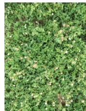
Trèfles Alexandrie Akeneton Flèche Viper