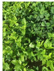
Cow Pea Black Stalion