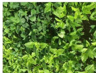
Cow pea, variété Black Stalion