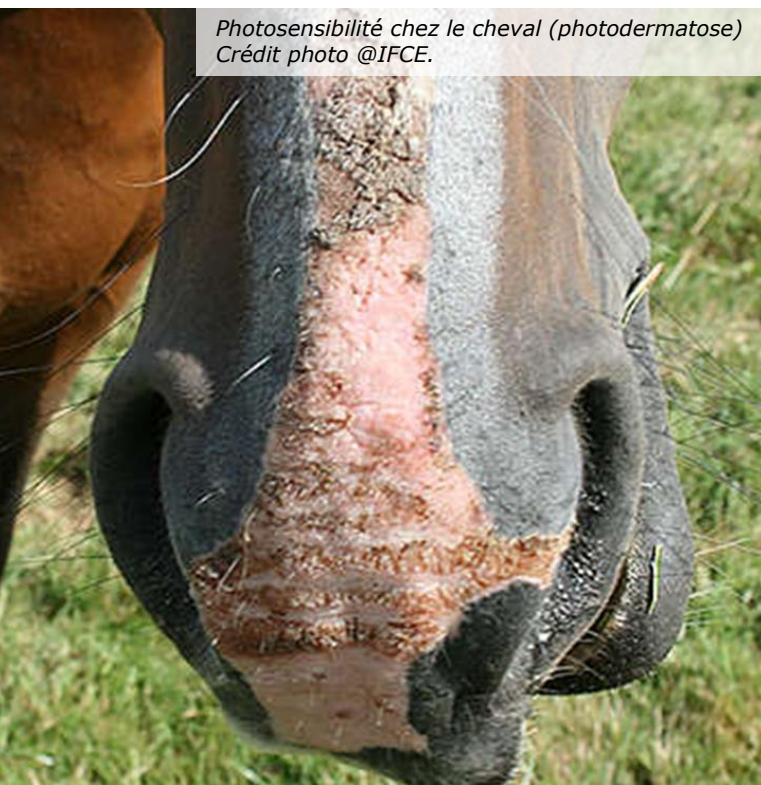
Photosensibilité chez le cheval (photodermatose)

Lésions à ne pas confondre avec la dermatite estivale causée par une allergie aux piqûres d'insectes et que l'on retrouve plutôt à la base de la queue et sur l'encolure.