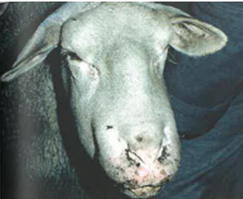
Œdème de la face (source : Maladies des moutons , J. BRUGERE PICOUX, édition France Agricole)