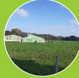
Prairie : pâturage tournant et foin