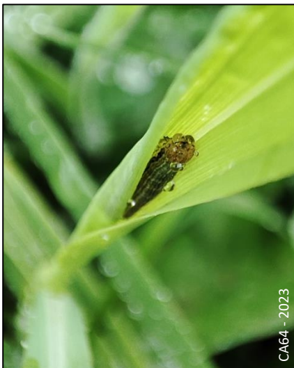
Chenille observée à Arette (2 cm)

Lors de la tournée de cette semaine, quelques traces de morsures ont été observées à ARETTE, GARINDEIN, JUXUE, HASPARREN, LOUHOSSOA, ITXASSOU et SAINT-PEE-SUR-NIVELLE.