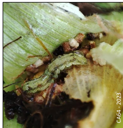
Héliothis observée sur du maïs à Saint-Pée-Sur-Nivelle

Des chenilles Héliothis sont toujours présentes sur le maïs, elles ont notamment été observées à Saint-Pée-sur-Nivelle. La chenille cause des dommages sur les épis de maïs doux, maïs semences, haricots verts, piments..., il faut donc faire preuve de vigilance. A ce stade, sur maïs, il n'y a rien à faire. La chenille consomme le haut de l'épi sans normalement s'étendre au-delà.